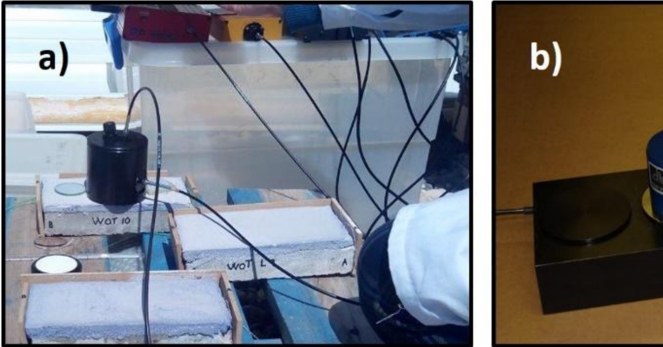
Figura 2. a) Medida de campo, de reflectancia, mediante un espectrómetro de fibra óptica comercial; b) Equipo portátil comercial para la medida de la emisividad.

aplicación específica, ni para las peculiaridades de esta nueva clase de materiales. Por ello, es necesario optimizar la metodología de caracterización de materiales ERD mediante medidas de campo. En este sentido, resulta imprescindible definir y fabricar sistemas de ERD “modelo”, reproducibles, y caracterizarlos mediante equipos de laboratorio de altas prestaciones. Estos sistemas servirán como referencia en la calibración de los equipos portátiles y también en la evaluación comparativa de distintos materiales.