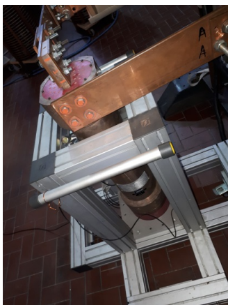
Fig. 1- derivatore compensato per forti correnti transitorie.

Per migliorare la precisione della taratura, e di conseguenza le CMC associate, il sistema sviluppato è basato sull'utilizzo di un multimetro Agilent (ora Keysight) 3458A utilizzato come digitalizzatore ad alta velocità. L'uso di tale multimetro come digitalizzatore è molto diffuso e molte valutazioni del suo comportamento sono disponibili in letteratura [3, 5]. In particolare in [3] il comportamento in frequenza è studiato, mostrando, per la banda di interesse fino a 1 kHz, un comportamento del guadagno costante.