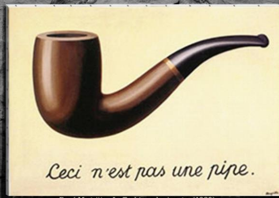
René Magritte - La Trahison des Images (1929)