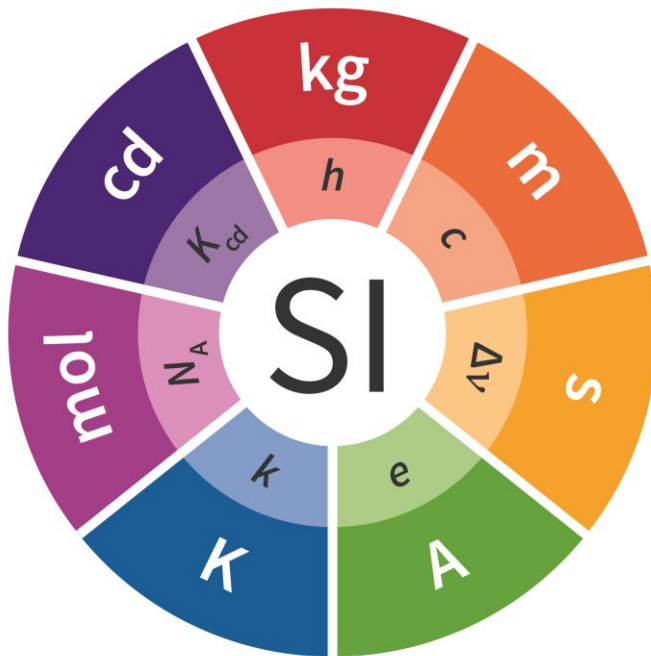
Figura 1. Logo del SI (Creative Commons License CC BY-ND 4.0) [3]

decisione, a partire dal 20 maggio 2019, tutte le unità di misura del SI sono definite in termini di costanti naturali, assicurando la futura stabilità del SI e aprendo la strada all'impiego di nuove tecnologie, incluse le tecnologie quantistiche, per la realizzazione delle definizioni. La figura 1 riporta il logo dell'attuale SI, indicando la corrispondenza tra le unità e la costante di pertinenza. Le definizioni attualmente in vigore delle unità di misura del SI sono riportate in tabella 1. Informazioni più dettagliate sul SI si possono reperire nella brochure del BIPM "The International System of Units". La nona edizione, quella corrente, è stata pubblicata nel 2019 ed è scaricabile dal sito web del BIPM [2].