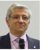
a cura di Alessandro Balsamo INRIM

◦ Il testo della bozza sarà modificato dalla task force di progetto secondo queste decisioni e distribuito agli esperti per valutazione fina-