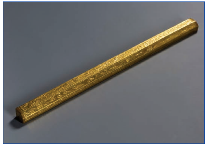
Figura 3 – Cubito regale egizio - Nuovo Regno, XVIII dinastia, 1539 a.C. - 1292 a.C. (conservato presso il Museo Egizio di Torino).

Misurare una lunghezza, ad esempio di una stoffa, significava stabilirne il rapporto con quella del cubito: una lunghezza di due cubiti era doppia di quella del cubito. Conseguenza diretta che la lunghezza del cubito era di un cubito esattamente . Quest'apparente ovvietà è invero tutt'altro che ovvia: definire un'unità di misura significa individuare in natura una grandezza di quel tipo e assegnarvi un valore numerico (1 nel caso del cubito) per definizione e quindi senza incertezza . Ciò non significa che le misure per riferimento a quell'unità siano perfette, sia perché la determinazione di quel rapporto è affetta da incertezza, sia perché la stessa unità di misura potrebbe essere definita in modo non totalmente univoco e perfettamente stabile nel tempo. Ad esempio, il cubito aveva facce estreme non perfettamente piane e parallele, e la sua lunghezza variava a seconda della scelta dei punti opposti; inoltre il legno di cui era fatto subiva invecchiamento e influenze ambientali, e quindi non era perfettamente stabile. Le definizioni delle unità di base fissano per convenzione il valore numerico di una grandezza. Scorrendo l'ultima colonna della tabella 4, si può notare che quella del kilogrammo è l'unica