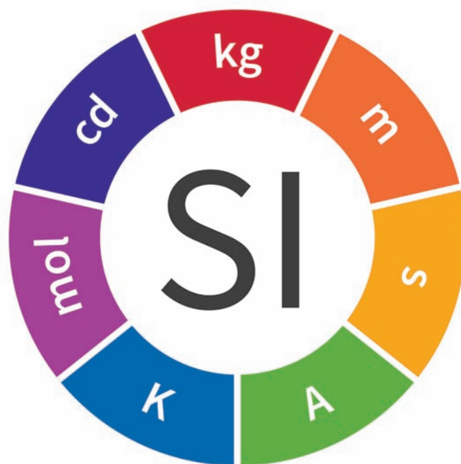
Figura 2 – Logo ufficiale dello SI.

sono i medesimi della corrispondente relazione fra grandezze: la 7-upla \{\alpha, \beta, \gamma, \delta, \epsilon, \zeta, \eta\} costituisce le "coordinate" non solo della grandezza ma anche della sua unità nello SI. Così, ad esempio, l'unità di densità \text{kg}/\text{m}^3 sarà identificata dalla 7-upla \{-3, 1, 0, 0, 0, 0, 0\} . Questo schema è riassunto in Tabella 1.