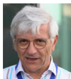
a cura di Alessandro Balsamo INRIM