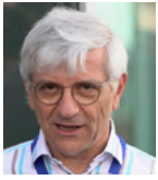
a cura di Alessandro Balsamo INRIM