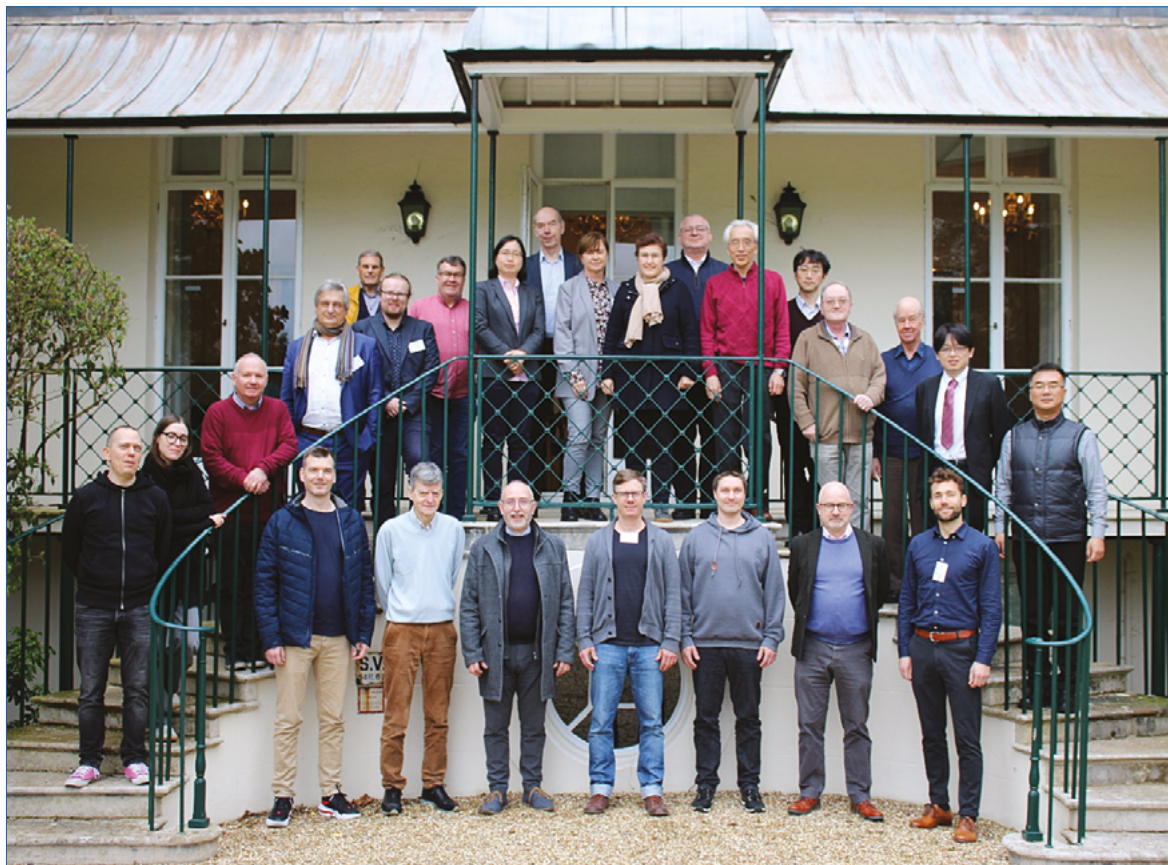
Foto di gruppo della ISO/TC 213