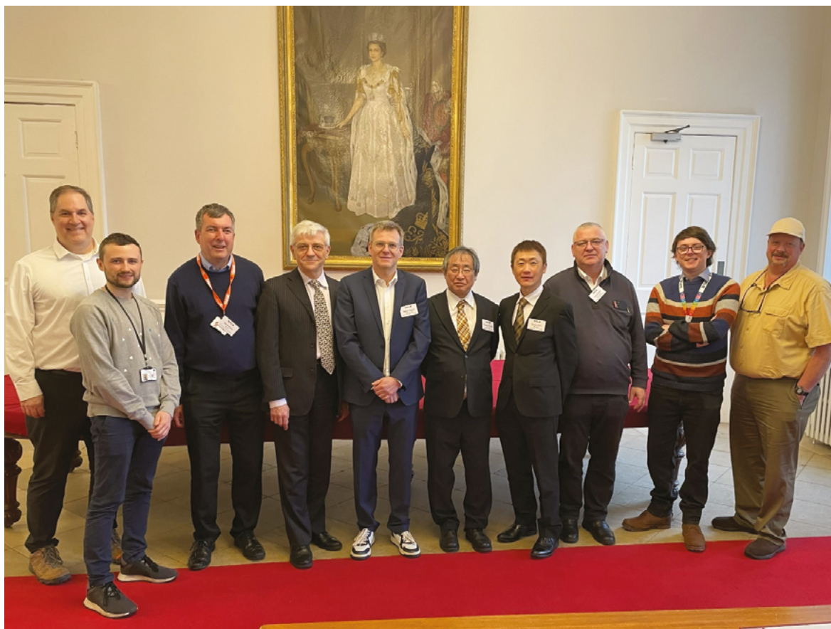
Foto di gruppo del WG 6