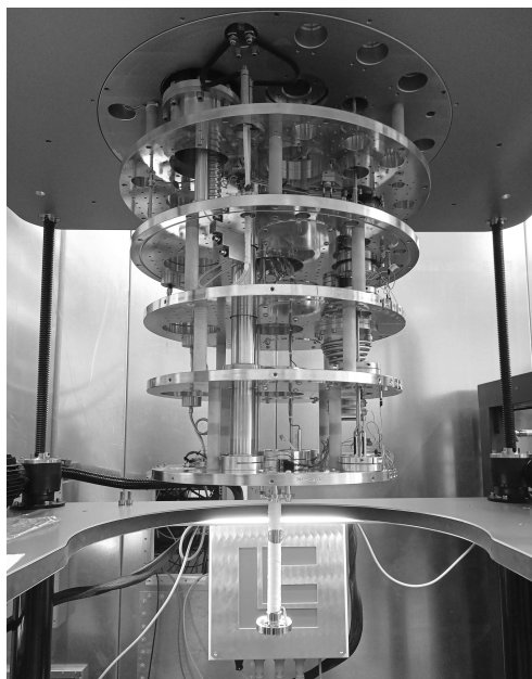
Figura 3: Il criomagnete a diluizione per gli esperimenti QAHE presso l'INRIM. Il portacampioni è all'estremo inferiore del sistema ed è inserito nel criomagnete a 9 T.

QAHE, sia, per campo fissato, misure accurate di resistenza di Hall (con target di accuratezza relativa 10^{-5} );